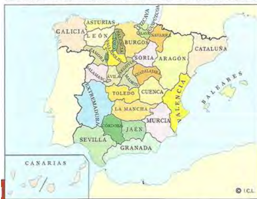
ESTRUCTURA ADMINISTRATIVA DE LA ESPAÑA DEL SIGLO XVIII